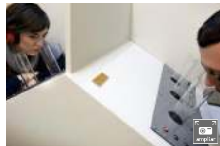
Imaginación y nuevas tecnologías para afrontar tiempos de crisis. En la imagen, un laboratorio de medición de olores de Barcelona.